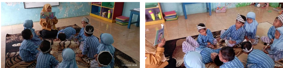
Gambar 1. Penerapan Pendekatan bercerita dengan Media Bercerita

Melalui media bercerita berbasis cerita, anak tidak hanya menerima pesan moral secara verbal, tetapi juga mengalami proses refleksi emosi secara sederhana dan konkret. Guru mengajak anak berdiskusi ringan mengenai perasaan tokoh dan mengaitkannya dengan pengalaman sehari-hari, seperti menunggu giliran atau mengendalikan keinginan. Kegiatan lanjutan berupa bermain peran secara bergiliran memperkuat pembiasaan perilaku sabar dan melatih regulasi diri anak. Dengan demikian, pendekatan bercerita melalui media bercerita menjadi sarana efektif untuk menumbuhkan kesabaran, ketenangan, serta kemampuan mengelola emosi anak usia dini secara alami dan sesuai dengan tahap perkembangannya.