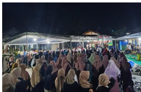
Gambar.02 Proses Pembacaan Diba' Al-Barzanji