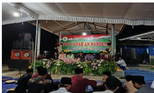
Gambar.01 Proses Internalisasi Nilai Akhlak

Berdasarkan keseluruhan temuan, Komunitas As-Sa'adah An-Nahdliyah berfungsi sebagai lembaga pendidikan non-formal yang efektif dalam menanamkan nilai akhlak remaja melalui pembiasaan, keteladanan, pendampingan, serta suasana kebersamaan. Tradisi Diba' Al-Barzanji terbukti tidak hanya sebagai ritual keagamaan, tetapi juga sebagai sarana internalisasi nilai yang kontekstual dan dekat dengan kehidupan masyarakat.