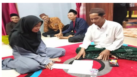
Gambar.03 Proses Wawancara dengan Pengurus

Faktor penghambat ini sejalan dengan konsep Al-Ghazali bahwa pembentukan akhlak tidak hanya bergantung pada niat individu, tetapi sangat dipengaruhi oleh kekuatan lingkungan. Lingkungan yang tidak kondusif, tekanan pergaulan, serta distraksi sosial dapat memperlambat proses internalisasi nilai, sehingga perlunya dukungan lebih besar dari pihak keluarga, komunitas, dan fasilitas pendukung.