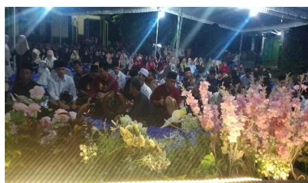
Gambar.04 Proses Internalisasi Nilai Akhlak

Penelitian menunjukkan bahwa tradisi Diba' Al-Barzanji berfungsi efektif sebagai media pendidikan akhlak non-formal melalui proses internalisasi nilai yang berlangsung secara bertahap, meliputi transformasi nilai, transaksi nilai, dan transinternalisasi nilai. Pada tahap transformasi nilai, pemahaman kognitif remaja dibangun melalui penjelasan makna syair Diba', kisah keteladanan Nabi Muhammad SAW, serta nasihat yang disampaikan oleh tokoh agama. Proses ini berperan sebagai fondasi awal dalam membentuk kesadaran moral remaja, karena nilai-nilai akhlak diperkenalkan tidak hanya secara normatif, tetapi juga dikontekstualisasikan dengan kehidupan keseharian mereka.