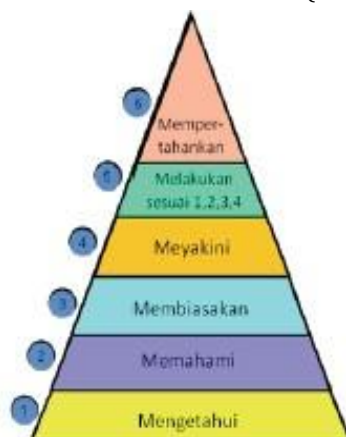
Gambar 2 Tahapan Pembentukan Karakter (Kemdiknas, 2011)

Pembentukan karakter sebagaimana digambarkan oleh Kemdiknas di atas, dapat diwujudkan melalui 6 tahapan yaitu melalui proses mengetahui, memahami, membiasakan, meyakini, melakukan sesuai dengan 1, 2, 3, 4 dan mempertahankannya. Oleh karena itu, pembentukan karakter bukanlah sesuatu yang mudah namun memang dapat diwujudkan melalui suatu proses di atas. Dikatakan bahwa pendidikan karakter merupakan suatu upaya yang terencana dalam menjadikan peserta didik untuk mengenal, peduli dan adanya suatu proses internalisasi nilai sehingga peserta didik menjadi berperilaku sebagai insan kamil (Kemdiknas, 2011: 8). Sejalan dengan hal di atas, pembentukan karakter harus dilakukan secara berkesinambungan dengan melibatkan aspek pengetahuan yang baik (moral knowing), perasaan yang baik atau loving good (moral feeling) dan perilaku yang baik (moral action) sehingga terbentuk kesatuan perilaku dan sikap hidup peserta didik (Kemdiknas, 2011: 6).