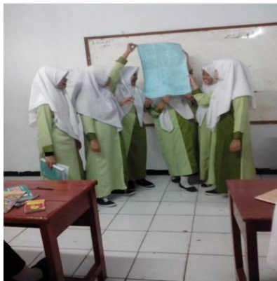
Gambar I Tanggung Jawab dalam Menyelesaikan Tugas

Proses pembelajaran mata pelajaran PKn dengan sistem boarding school yang dilaksanakan di salah satu sekolah boarding school di Purwakarta melaksanakan kurikulum keagamaan dan kurikulum nasional, adapun penjelasan singkat yang peneliti dapatkan