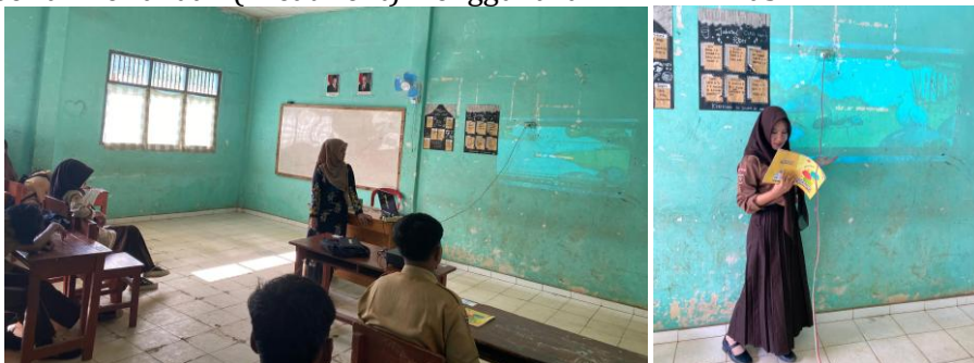
Gambar 2. Pembelajaran menggunakan film animasi

Setelah pretest, siswa diberikan perlakuan dalam bentuk pembelajaran menggunakan media film animasi selama empat minggu dengan durasi 2 sesi per minggu. Setiap sesi berlangsung selama 45 menit, di mana siswa menonton film animasi yang berisi kosakata bahasa Inggris yang sesuai dengan kurikulum mereka.