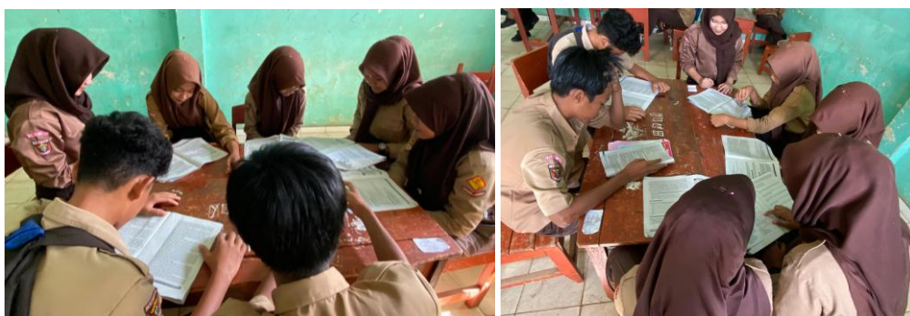
Gambar 3. Diskusi siswa

Setelah pretest, siswa diberikan perlakuan dalam bentuk pembelajaran menggunakan media film animasi selama empat minggu dengan durasi 2 sesi per minggu. Setiap sesi berlangsung selama 45 menit, di mana siswa menonton film animasi yang berisi kosakata bahasa Inggris yang sesuai dengan kurikulum mereka.