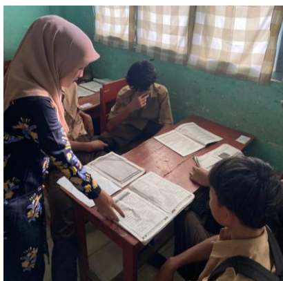
Gambar 1. Pre-test

Sebelum perlakuan diberikan, dilakukan tes awal (pretest) untuk mengukur tingkat penguasaan kosakata bahasa Inggris siswa. Tes ini terdiri dari 10 soal pilihan ganda yang mengukur pemahaman siswa terhadap kosakata dasar dan penggunaannya dalam konteks kalimat. Deskripsi data hasil pre-test pada tabel 1.