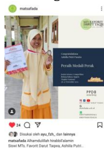
Gambar 2, Postingan IG MTs

Siswa yang diterima di MTs Favorit Darut Taqwa memiliki latar belakang yang beragam, yang menciptakan tantangan tersendiri dalam hal penghargaan dan pengakuan. Terdapat anggapan bahwa siswa dari kelompok minoritas mungkin tidak mendapatkan penghargaan yang setara dengan siswa mayoritas, meskipun mereka menunjukkan prestasi yang sama atau bahkan lebih baik. Ketidakadilan ini dapat menciptakan rasa ketidakpuasan dan mengurangi motivasi siswa untuk berprestasi. Tantangan ini penting untuk diatasi dengan memastikan sistem penghargaan yang adil dan transparan. Pengakuan terhadap prestasi siswa tanpa memandang latar belakang mereka adalah kunci untuk menjaga motivasi dan semangat belajar di sekolah. Pernyataan tersebut didukung dengan postingan platform media sosial Instagram milik MTs Favorit Darut Taqwa terkait apresiasi siswa tanpa memandang latar belakang.