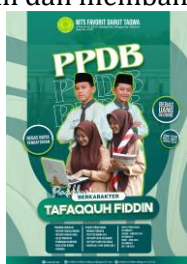
Gambar 1, Brosur MTs

Salah satu kebijakan utama yang diterapkan oleh sekolah ini adalah kebijakan penerimaan siswa yang tidak memandang latar belakang agama, suku, atau status sosial ekonomi. Menurut Kesiswaan Madrasah, siswa dari berbagai kelompok masyarakat, baik yang berasal dari keluarga Muslim maupun non-Muslim, diberi kesempatan yang sama untuk melanjutkan pendidikan di MTs Favorit Darut Taqwa (Firdaus, 2025). Apabila kebijakan penerimaan siswa dengan latar belakang tersebut tidak dilakukan, siswa dari keluarga kurang mampu akan kesulitan mendaftar karena biaya atau persyaratan akademik yang tidak mempertimbangkan kondisi sosial mereka. MTs Favorit Darut Taqwa juga memiliki siswa yang berasal dari keluarga non muslim dan suku yang menjadi minoritas di sekolah, sehingga apabila kebijakan sekolah tersebut tidak ada mereka akan merasa kurang diterima atau bahkan mengalami diskriminasi secara halus dalam proses seleksi atau selama belajar di sekolah. Lewat kebijakan penerimaan siswa tanpa memandang latar belakang tersebut, siswa MTs Favorit Darut Taqwa memiliki kesempatan untuk belajar dari perbedaan dan membangun sikap toleransi.