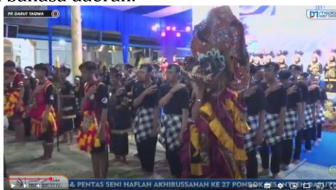
Gambar 3, Tampilan seni siswa

Kebijakan inklusif yang diterapkan oleh MTs Favorit Darut Taqwa juga tercermin dalam kegiatan sekolah sehari-hari. Salah satunya adalah pengelolaan kegiatan ekstrakurikuler yang dirancang agar semua siswa dapat berpartisipasi aktif, tanpa dibatasi oleh latar belakang budaya dan bahasa(Yusuf, 2025). Hal ini sejalan dengan konsep pendidikan multikultural, yang tidak hanya mendorong keberagaman dan inklusivitas, tetapi juga berperan penting dalam memperkuat identitas nasional bangsa Indonesia. Dengan mengimplementasikan pendidikan multikultural dalam kehidupan sehari-hari, sekolah turut menanamkan rasa cinta tanah air serta loyalitas kepada bangsa Indonesia(Mubin & Bakri, 2021). Kegiatan seperti pramuka, seni, olahraga, dan seni budaya memungkinkan siswa untuk mengenal, mengapresiasi, dan mempraktikkan keberagaman budaya yang ada di sekitar mereka. Dalam kegiatan ini, siswa diberi kebebasan untuk mengekspresikan identitas budaya mereka, baik melalui tarian, musik, pakaian tradisional, maupun bahasa daerah.