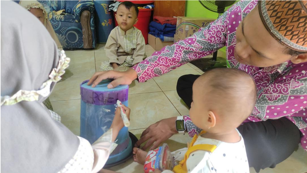
Gambar 15. Anak Menulis Nama Pada Topi Sulap