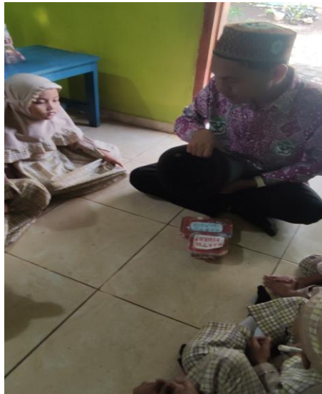
Gambar 7. Guru Memperlihatkan Keadaan Topi yang Kosong Sebelum membaca Bismillah dan Abrakadabra