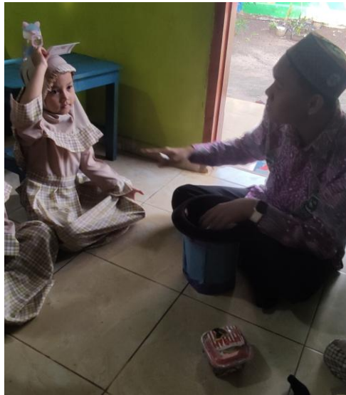
Gambar 11. Anak Meletakkan Kartu Diatas Kepala Kemudian Guru Memberikan Petunjuk Gambar Apa Yang Ada Diatas Kepalanya