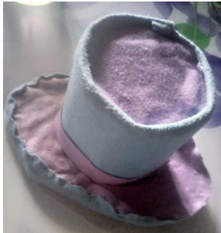
Gambar 1. Desain Awal