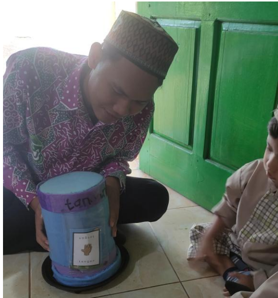
Gambar 9. Guru mengeluarkan Beberapa Kartu Pada Bagian dalam Topi