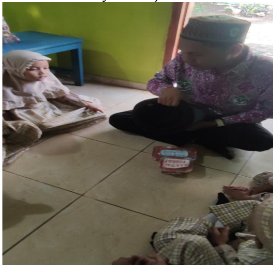
Gambar 8. Guru Menutup Topi Menggunakan Kain