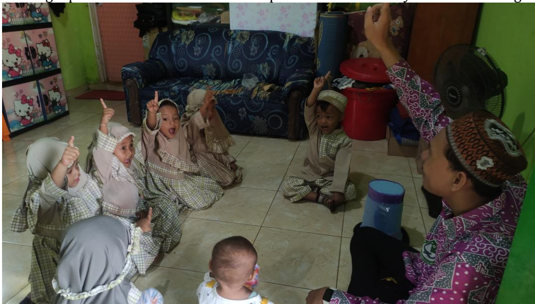
Gambar 14. Anak Berantusias Untuk Mencoba Menulis Nama Mereka