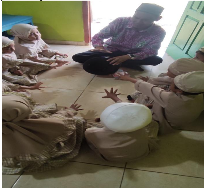
Gambar 6. Mengucapkan basmallah dan abakadabra

Adapun dokumentasi gambar sebagai penguat hasil observasi dan wawancara tersebut diatas, yaitu sebagai berikut: