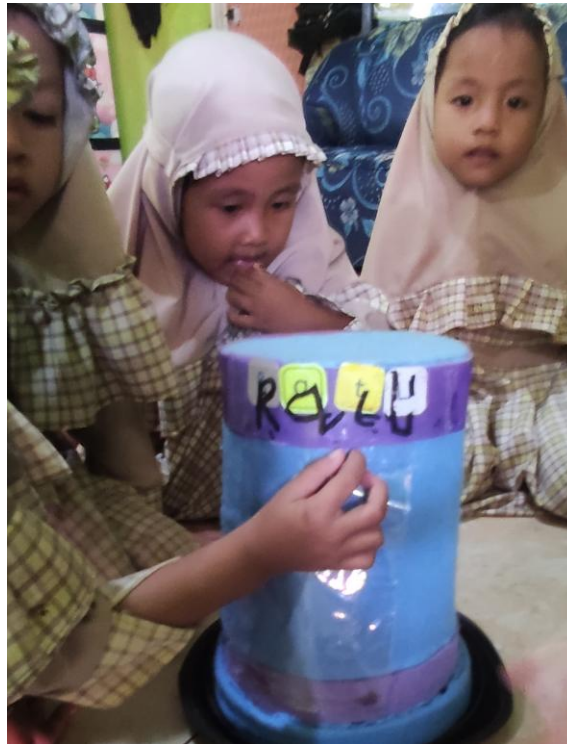
Gambar 17. Anak membaca nama yang sudah ditulis

10. Bermain dapat dilakukan oleh anak, jika sudah memahami tahapan bermain.