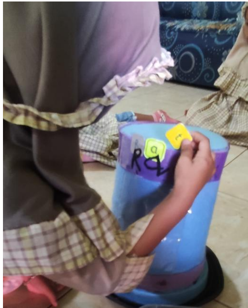
Gambar 13. Anak Menemukan Kata Yang Persis Ditulis Guru Kemudian Di Masukkan Kedalam Bagian Yang Di Sediakan Di Topi Sulap dengan Kata Yang ditulis Guru Pada Topi Sulap