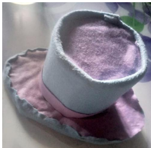
Gambar 2. Media Sebelum Revisi

Berdasarkan hasil validasi dari Ferdian Utama, M.Pd selaku ahli materi dapat diketahui topi sulap memperoleh keterangan ada. Setelah desain produk divalidasi oleh ahli materi dan ahli media, maka dapat diketahui kelemahan dari topi sulap tersebut. Kelemahan tersebut kemudian diperbaiki untuk menghasilkan produk yang lebih baik lagi. Adapun saran dari ahli media yaitu sebagai berikut: 1) Berikan warna dasar yang lebih cerah sehingga terlihat menarik untuk anak. 2) Berikan beberapa motif, contohnya motif bintang, 3) Gunakan beberapa warna, jangan hanya satu warna saja. Berdasarkan saran dari ahli media dan ahli materi, maka peneliti melakukan perbaikan-perbaikan sesuai dengan arahan ahli media tersebut, yaitu: