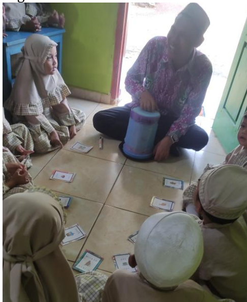
Gambar 12. Anak Mencari Kata Yang Sesuai

Adapun dokumentasi gambar sebagai penguat hasil observasi dan wawancara tersebut diatas, yaitu sebagai berikut: