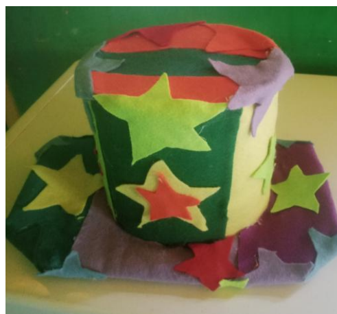
Gambar 3. Media Setelah Revisi

Adapun ujicoba produk ini merupakan ujicoba pemakaian yang ditujukan kepada anak kelompok usia 5-6 tahun sebagai pengguna bahan ajar yang dalam penelitian