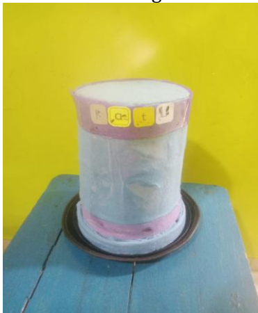
Gambar 4. Produk Akhir

Berdasarkan hasil validasi kepada ahli media dan ahli materi, serta hasil uji coba untuk mengetahui respon anak, maka produk topi sulap tidak mengalami uji coba ulang dan sudah valid, maka topi sulap ini siap digunakan dan dimanfaatkan di RA Al Khairiyah Kec. Melinting pada anak kelompok usia 5-6 tahun. Adapun produk akhir topi sulap yang dikembangkan dalam penelitian ini adalah sebagai berikut: