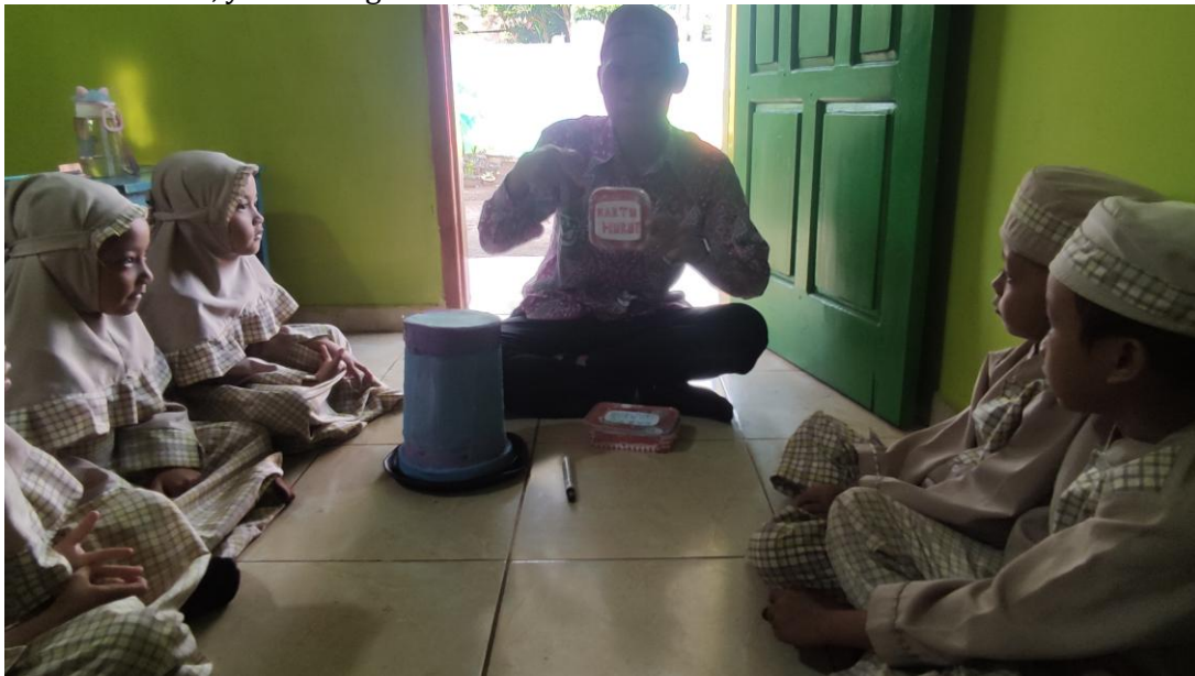
Gambar 5. Guru Menyiapkan Media Topi Sulap

Adapun dokumentasi gambar sebagai penguat hasil observasi dan wawancara tersebut diatas, yaitu sebagai berikut: