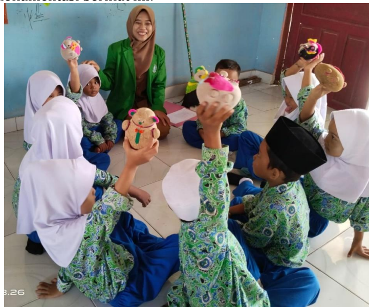
Gambar 14. Seluruh anak mendapat giliran bermain

Berdasarkan hasil observasi dan wawancara tersebut di atas, hal ini sesuai dengan hasil dokumentasi berikut ini: