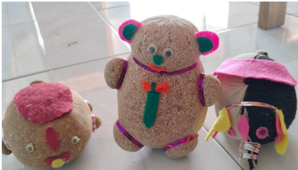
Gambar 3. Media Boneka Horta Setelah Revisi