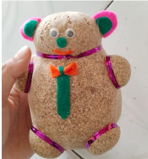
Gambar 2. Media Boneka Horta Sebelum Revisi