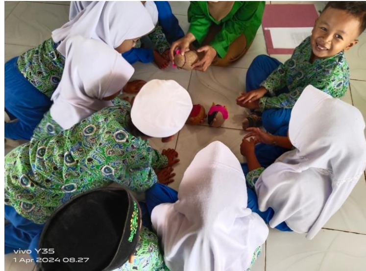
Gambar 12. Anak bercerita menggunakan bahasa sendiri

Berdasarkan hasil observasi dan wawancara tersebut di atas, hal ini sesuai dengan hasil dokumentasi berikut ini: