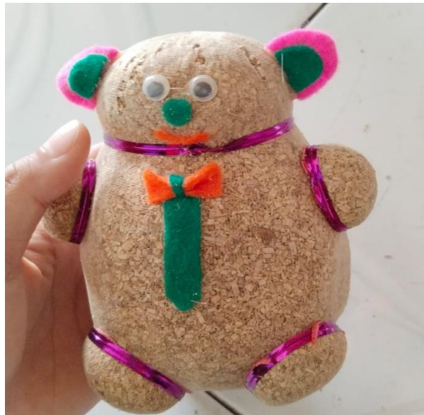
Gambar 1. Desain Media Boneka Horta

media pembelajaran yang dikembangkan dari bahan serbuk kayu yang dibentuk seperti boneka dengan menggunakan kain transparan sebagaimana yang dipergunakan untuk membuat boneka horta sebagai media tanam. Adapun desain produk media boneka horta dalam penelitian ini adalah: