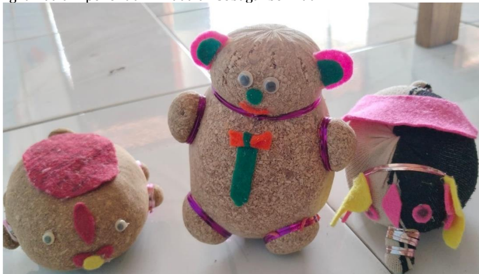
Gambar 4. Produk Akhir Media boneka horta

Berdasarkan hasil ujicoba produk yang peneliti lakukan kepada anak usia 4-5 tahun di RA Wajar Fantri Bakti Sumber Baru menunjukkan bahwa media boneka horta telah berhasil mengembangkan kemampuan aspek bahasa pada anak. Selanjutnya berdasarkan hasil validasi kepada ahli media dan ahli materi, serta hasil ujicoba, maka produk media boneka horta tidak mengalami uji coba ulang dan sudah layak, maka media boneka horta ini siap digunakan dan dimanfaatkan di RA Wajar Fantri Bakti Sumber Baru pada anak kelompok usia 4-5 tahun. Adapun produk akhir media boneka horta yang dikembangkan dalam penelitian ini adalah sebagai berikut: