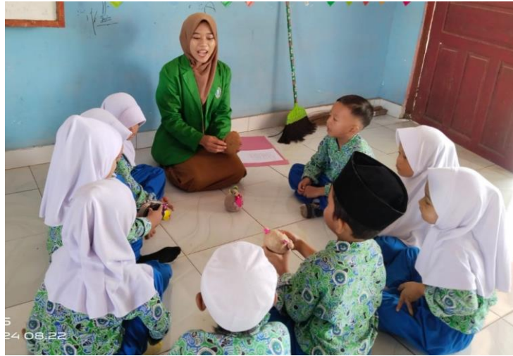
Gambar 10. Guru dan anak saling berinteraksi

Berdasarkan hasil wawancara, observasi dan dokumentasi pada langkah permainan tersebut diatas, indikator kemampuan aspek bahasa yang muncul adalah anak mampu menyimak perkataan orang lain dan memahami cerita yang dibacakan. Selain itu anak mulai mengerti dua perintah yang diberikan bersamaan serta anak mulai terlihat mengenal perbendaharaan kata mengenai kata sifat.