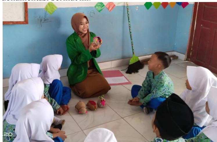
Gambar 8. Guru bercerita

Berdasarkan hasil observasi dan wawancara tersebut di atas, hal ini sesuai dengan hasil dokumentasi berikut ini: