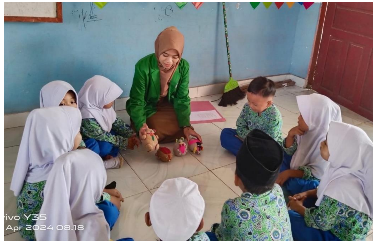
Gambar 9. Anak menyimak perkataan guru

Berdasarkan hasil observasi dan wawancara tersebut di atas, hal ini sesuai dengan hasil dokumentasi berikut ini: