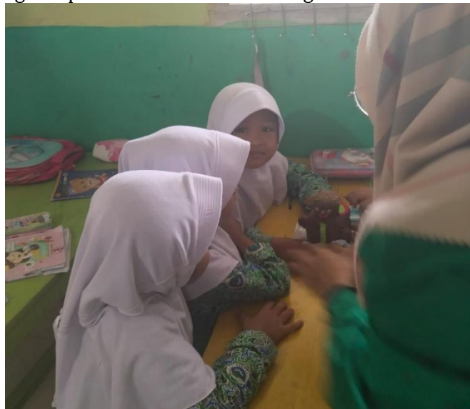
Gambar 11. Anak bermain dengan boneka horta

Berdasarkan hasil wawancara, observasi dan dokumentasi pada langkah permainan tersebut diatas, indikator kemampuan aspek bahasa yang muncul adalah anak mampu menyimak perkataan orang lain dan memahami cerita yang dibacakan. Selain itu anak mulai mengerti dua perintah yang diberikan bersamaan serta anak mulai terlihat mengenal perbendaharaan kata mengenai kata sifat.