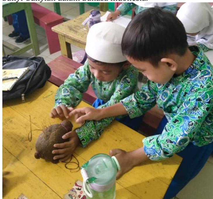
Gambar 13. Anak bercerita menggunakan boneka horta

Berdasarkan hasil wawancara, observasi dan dokumentasi pada langkah permainan tersebut diatas, indikator kemampuan aspek bahasa yang muncul adalah anak memahami cerita yang dibacakan serta anak mampu mendengar dan membedakan bunyi-bunyian dalam Bahasa Indonesia.