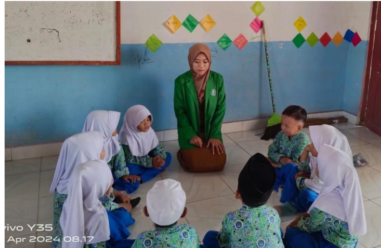
Gambar 5. Posisi duduk membentuk lingkaran

Berdasarkan hasil observasi dan wawancara tersebut di atas, hal ini sesuai dengan hasil dokumentasi berikut ini: