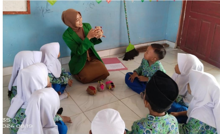
Gambar 7. Menjelaskan karakter boneka horta

Berdasarkan hasil observasi dan wawancara tersebut di atas, hal ini sesuai dengan hasil dokumentasi berikut ini: