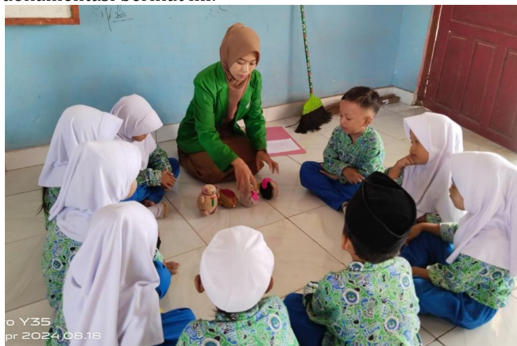
Gambar 6. Menyiapkan media boneka horta

Berdasarkan hasil observasi dan wawancara tersebut di atas, hal ini sesuai dengan hasil dokumentasi berikut ini: