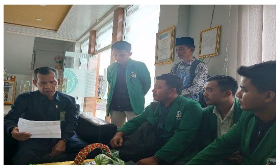
Gambar 1. Proses Wawancara terhadap hakim tentang mediasi