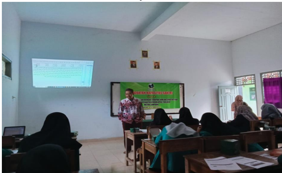
Gambar 3. Penguasaan materi Jumlah Syart}iyyah dan penerapannya terhadap memahami Al-Qur'an

Sebelum pelaksanaan kegiatan ini diadakan, tim pengabdian telah melakukan persiapan kegiatan dan Focus Group Discussion (FGD) terlebih dahulu. Hal ini dilakukan guna melihat sebatas mana persiapan acara serta penyamaan persepsi antara tim pengabdian dan narasumber sehingga tidak terjadi kasalah pahaman diantara keduanya. Kegiatan PKM dilaksanakan dalam 3 sesi pertemuan yaitu: 1) Pertemuan pertama diawali dengan seremonial pembukaan acara. Selanjutnya pada sesi pertama ini, materi yang disampaikan yaitu mengenai Jumlah Syart}iyyah, pengertian Jumlah Syart}iyyah, Adawatus Syarhi, fi'il Syart}iyyah dan Jawab Syarsat, macam-macam Adawatu Syart}iyyah berdasarkan fungsinya baik yang dapat menjazamkan fi'il dan yang tidak dapat menjazamkan fi'il. Agar lebih menarik beberapa contoh Jumlah Syart}iyyah di beri perbedaan warna pada setiap kedudukannya agar mempermudah santri dalam membedakan Adawatus Syarhi, fi'il Syart}iyyah dan Jawab Syarat.