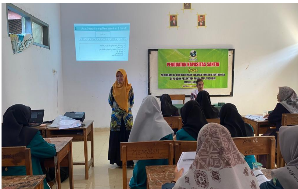
Gambar 3. Beberapa contoh ayat yang telah berhasil ditelaah kedudukannya oleh para santri