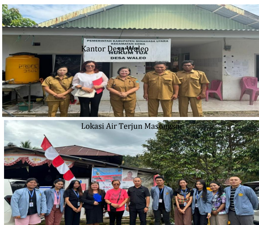
Figure 1 Pemberdayaan Masyarakat melalui Pengembangan Objek Wisata Air Terjun Masongsor

Masyarakat Desa merupakan bagian kehidupan dari ekosistem, pelaksanaan hukum harus sesuai dengan realita masyarakat karena negara, masyarakat dan badan hukum pada dasarnya merupakan subjek hukum yang dapat menjadi pendukung hak dan kewajiban dalam pengelolaan dan pemanfaatan sumber daya alam sedangkan yang menjadi objek hukum adalah sumber daya alam Air Terjun Masongsor di Desa Waleo sehingga pengaturan hukum pengembangan sumber daya alam harus diwujudkan secara adil berdasarkan sistem hukum nasional.