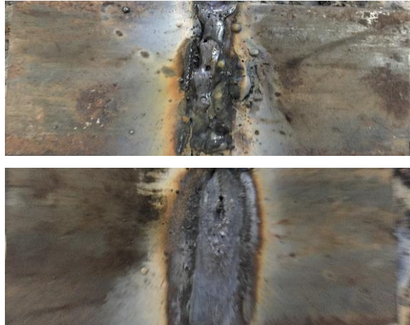
Gambar 6. Hasil pengelasan dari 4 sampel pengelasan

Sedangkan untuk melihat prosentase distribusi pemahaman peserta penyuluhan dapat dilihat pada tabel 2.