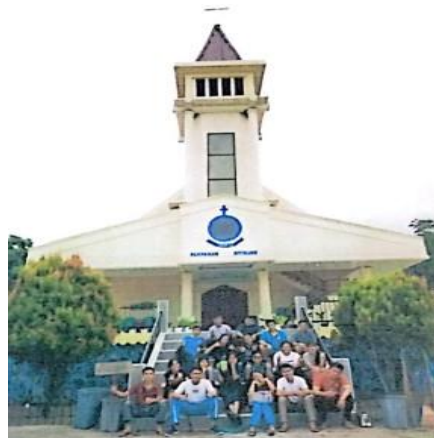
Gambar 3. Kegiatan bersama Sekolah Minggu

Selain faktor keluarga, lingkungan sosial juga berperan penting dalam membentuk kebahagiaan remaja dan anak-anak. Interaksi dengan teman sebaya, dukungan dari komunitas, dan partisipasi dalam kegiatan sosial dapat memberikan anak-anak perasaan diterima dan dihargai oleh lingkungan sekitar. Lingkungan sosial yang mendukung dapat membantu membangun rasa keterikatan sosial dan meningkatkan kesejahteraan emosional mereka. Di lingkungan gereja, misalnya, remaja dan anak-anak dapat merasa aman, terhubung, dan didukung oleh komunitas yang memiliki nilai-nilai bersama.