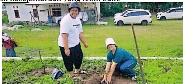
Gambar 4. Kegiatan Penanaman Pohon bersama Remaja)

Strategi lainnya melibatkan penguatan keterampilan sosial dan emosional anak-anak. Ini dapat mencakup program pelatihan keterampilan sosial, dukungan psikososial di sekolah, dan promosi keterampilan coping yang positif. Dengan memberikan anak-anak dan remaja alat yang mereka butuhkan untuk mengatasi tantangan dan membangun ketahanan, kita dapat membantu mereka menghadapi situasi yang menantang dengan lebih baik dan meraih kesejahteraan yang lebih baik.