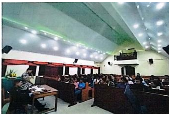
Gambar 2. Diskusi bersama remaja)

Selain itu, HKBP Pakpahan Sitinjak juga menawarkan berbagai program kegiatan khusus untuk remaja dan anak-anak. Program-program ini mencakup kegiatan rohani, pendidikan, sosial, dan rekreasi yang dirancang untuk mempromosikan interaksi positif, perkembangan keterampilan, dan rasa kepemimpinan yang sehat di antara peserta. Dalam kegiatan rohani, remaja dan anak-anak diajak untuk lebih mendalami iman mereka melalui doa, bacaan Alkitab, dan aktivitas rohani lainnya. Program pendidikan memberikan kesempatan bagi mereka untuk belajar dan meningkatkan pengetahuan mereka dalam berbagai bidang, sementara kegiatan sosial dan rekreasi memberikan kesempatan untuk bersosialisasi, berinteraksi, dan bersenang-senang dengan teman sebaya.