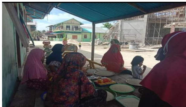
Gambar 1. Ibu-ibu Warga Dullah Laut yang mengikuti Yellim

Pemberian ini bermacam-macam mulai dari beras, bahan masakan, bumbu dan lain-lain yang nantinya akan dimasak untuk menjamu para tamu dalam tahapan berikutnya. Tidak sedikit warga yang memberikan sumbangan cukup banyak namun ada pula yang memberikan sesuai kemampuannya.