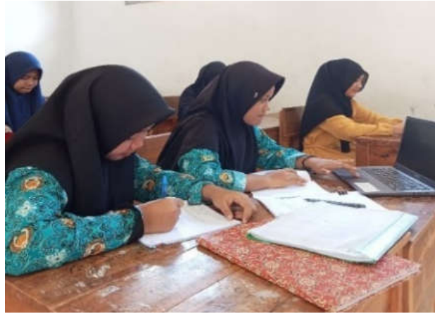
الصورة ٢. أسلوب التعلم المرئي

السبب في ميل الطلبة إلى أساليب التعلم المرئي هو أن نتائج الاستبيانات التي أجراها الباحثون تظهر أن طلبة الصف العاشر مدرسة العالية معارف روضة الطالبين لديهم ميل كبير نحو السيطرة على أساليب التعلم المرئي. أصبحت هذه النتائج النقطة المحورية للدراسة، والتي تهدف إلى تعميق فهم تفضيلات التعلم المرئي هذه من أجل تلبية احتياجات الطلبة وتفضيلات التعلم بشكل أفضل. بعد تحليلها من خلال إيجاد عدة عوامل، إليك مثال على أسلوب التعلم المرئي للطلبة، والذي يتضح بالصورة أدناه: