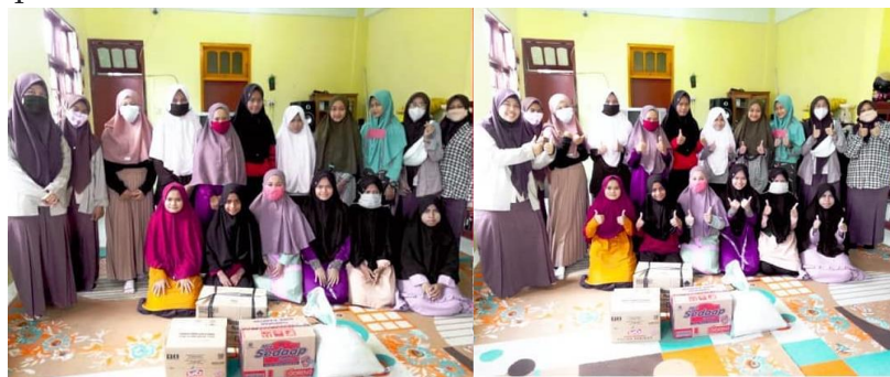
Gambar 3 Pengajian maupun Kegiatan Ibadah Lain Bersama

Hasil wawancara dari salah satu pengurus, dikatakan bahwa untuk kegiatan ini murni dari masing-masing anggota atau dengan kata lain tidak ada biaya yang keluar dari kas Remaja Madiun Berbagi. Biasanya setelah pengajian pagi selesai, para pengurus sarapan bersama dilanjutkan membahas program kegiatan yang akan dilaksanakan kedepannya, seperti kegiatan rutin Jumat Berbagi dan Berbagi Sembako pada Panti Asuhan.