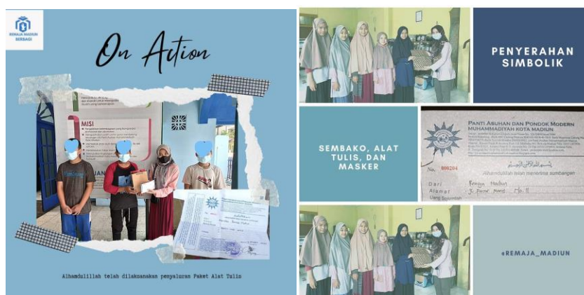
Gambar 2 Kegiatan Berbagi Sembako Kepada Panti Asuhan