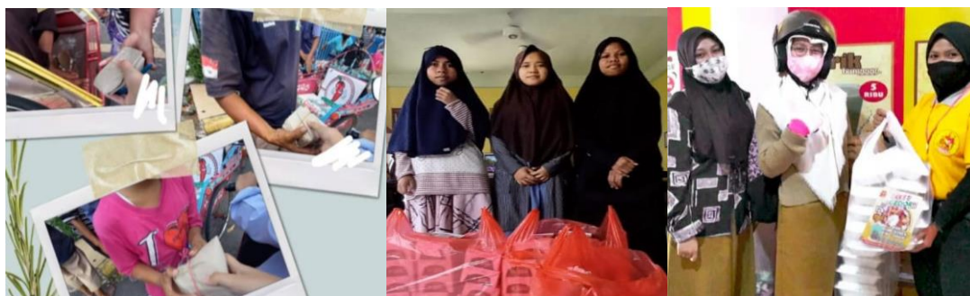
Gambar 1 Kegiatan Berbagi Nasi

Awal mula berdirinya, kegiatan ini menyalurkan donasi berupa nasi dan air yang dibawa oleh masing-masing anggota seikhlasnya. Kemudian, sehubungan dengan dikenalnya dan majunya Remaja Madiun Berbagi sehingga sudah semakin banyak donasi yang datang baik dalam bentuk uang maupun konsumsi itu sendiri. Oleh karena itu, kegiatan Berbagi Nasi yang selanjutnya juga dikenal dengan kegiatan Jumat Berbagi pun menjadi lebih terbantu dalam hal tugas dan kewajibannya.