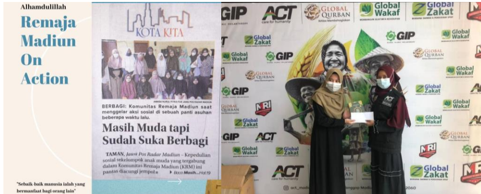
Gambar 5 Kegiatan Bakti Sosial