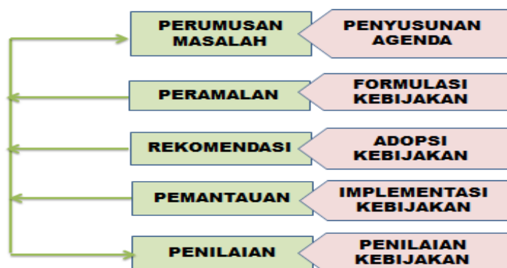
Gambar 4. Tahap pembuatan Kebijakan William N. Dunn

Dalam proses pembuatan kebijakan ini pada akhirnya juga akan memerlukan analisis dalam perbaikannya. Maka dalam konsep kebijakan soal penerapan sistem zonasi di Kota Kupang sebagai alternative jawaban dari pertanyaan yang sering dimunculkan soal keadilan dalam mengakses dunia pendidikan agar merata tanpa ada diskriminasi soal kehidupan status sosial dan lain sebagainya. Dengan demikian diketahui bahwa analisis kebijakan soal perdebatan yang sering dipersoalkan oleh orang tua murid dapat memberikan jawaban atas masalah-masalah yang sering diributkan oleh orang tua wali peserta didik baik dari jenjang SD, SMP dan SMA disetiap awal tahun ajaran baru. Hadirnya analisa soal kebijakan ini sebagai alternative dalam memberikan kesempatan kepada anak untuk mengakses pendidikan yang bermutu di Kota Kupang.