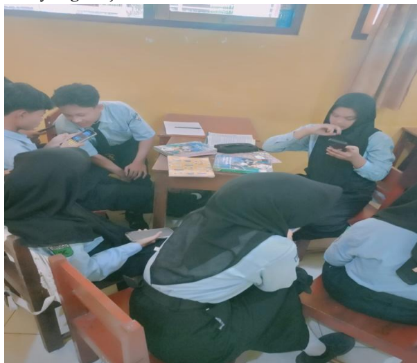
Gambar 3. Diskusi dalam bermedia sosial

Penelitian ini juga menemukan bahwa siswa SMAN 1 Blora bersikap selektif terhadap nilai akhlak Islam yang mereka terima. Sikap selektif ini terlihat dari kecenderungan siswa untuk membandingkan nilai yang diajarkan guru PAI dengan nilai yang mereka temui di media sosial. Konten keagamaan populer, figur publik religius, serta narasi moral yang viral turut memengaruhi cara siswa memaknai ajaran akhlak Islam. Dalam beberapa kasus, siswa menyatakan mengalami kebingungan ketika nilai yang berkembang di media sosial bertentangan dengan nilai yang diajarkan di kelas.