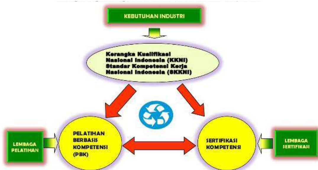
Gambar 1 Strategi Pengembangan SDM Indonesia Berbasis Kompetensi Sumber: Departemen Perindustrian

tidak terserap dalam dunia kerja, disebabkan oleh banyak faktor di antaranya: 1) jumlah penduduk yang semakin hari semakin bertambah; 2) pertumbuhan angkatan kerja lebih besar ketimbang ketersediaan lapangan kerja; 3) distribusi penduduk antar daerah tidak merata; 4) ketidaksesuaian kompetensi SDM dengan pasar kerja, distribusi informasi tentang pasar kerja yang lambat atau timpang, dan tingginya tingkat pengangguran. Kondisi ini menghambat lajunya penyerapan tenaga kerja baik mereka yang berlatar belakang pendidikan rendah, maupun Perguruan Tinggi. Untuk itu, sangat diperlukan strategi pengembangan SDM di Indonesia yang berbasis kompetensi. Dengan demikian, kelulusan mahasiswa dapat sesuai dengan kebutuhan industri dan dibekali dengan pelatihan dan sertifikasi kompetensi (Gambar 1).