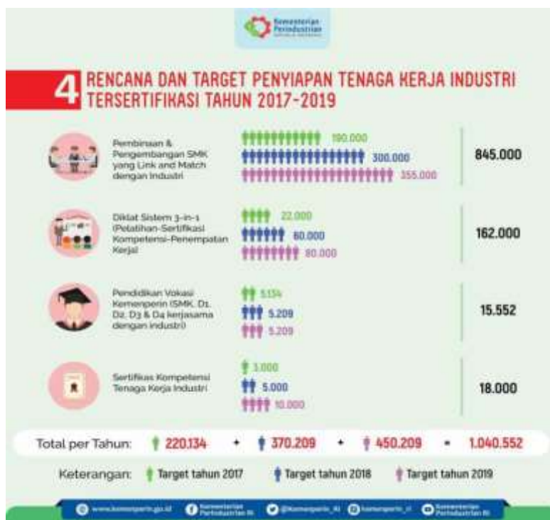
Gambar 4 Target Penyerapan Tenaga Kerja Sumber Departemen Perindustrian

Yang dibutuhkan Indonesia sekarang ini adalah visioning (pandangan), repositioning strategy (strategi), dan leadership (kepemimpinan). Tanpa itu semua, kita tidak akan pernah beranjak dari transformasi yang terus berputar-putar. Dengan visi jelas, tahapan-tahapan yang juga jelas, dan komitmen semua pihak serta kepemimpinan yang kuat untuk mencapai itu 2. Saran Pendidikan di Indonesia diharapkan dapat mempersiapkan peserta didik menjadi warga negara yang memiliki komitmen kuat dan konsisten untuk mempertahankan Negara Kesatuan Republik Indonesia.