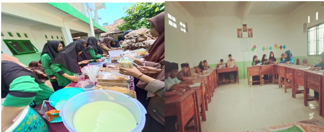
Gambar 1.2 Hasil Metode Penelitian Kooperatif

Salah satu wujud dari hasil model pembelajaran kooperatif yang diterapkan dalam Pendidikan Agama Islam adalah adanya peningkatan keaktifan siswa-siswi kelas VIII SMP Ma'arif Ansoru Al Hasaniyah Rumbia.