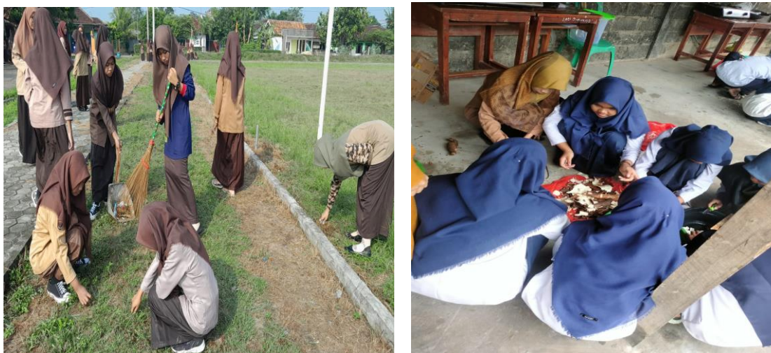
Gambar 1.3 Hasil Metode Penelitian Berbasis Masalah

Salah satu wujud dari hasil model pembelajaran berbasis masalah yang diterapkan dalam Pendidikan Agama Islam adalah adanya peningkatan daya pola fikir siswa-siswi kelas VIII SMP Ma'arif Ansoru Al Hasaniyah Rumbia.