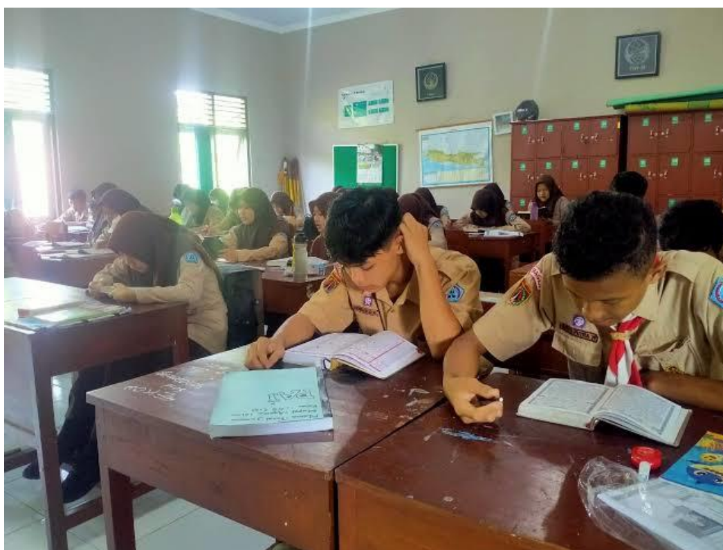
Gambar 3. Kegiatan Tadarus Al-Qur'an

Berdasarkan hasil observasi yang telah peneliti lakukan maka dapat disimpulkan bahwa proses guru di SMAN 1 Adiluwih dalam perannya sebagai pembimbing dalam mengembangkan kecerdasan spiritual sudah terlaksana sebagaimana mestinya dan mampu menghasilkan lulusan yang baik meskipun tidak mencakup lulusan keseluruhan. Dari sini kita dapat mengetahui yang membedakan guru sebagai pendidik dan pembimbing ialah dari segi pengaplikasiannya yang mana guru sebagai pendidik lebih menekankan kepada pemberian tugas terhadap siswa sehingga dengan adanya penugasan tersebut siswa dapat terlatih kecerdasan spiritual siswa. Sedangkan peran guru sebagai pembimbing lebih menekankan kepada guru yang membantu memecahan permasalahan yang sedang dihadapi oleh siswa. Sebagaimana dalam hal kegiatan tadarus al-Qur'an, dimana seorang guru membimbing dan mengoreksi permasalahan atau kesalahan bacaan yang dilakukan oleh siswa, sebagaimana gambar berikut: