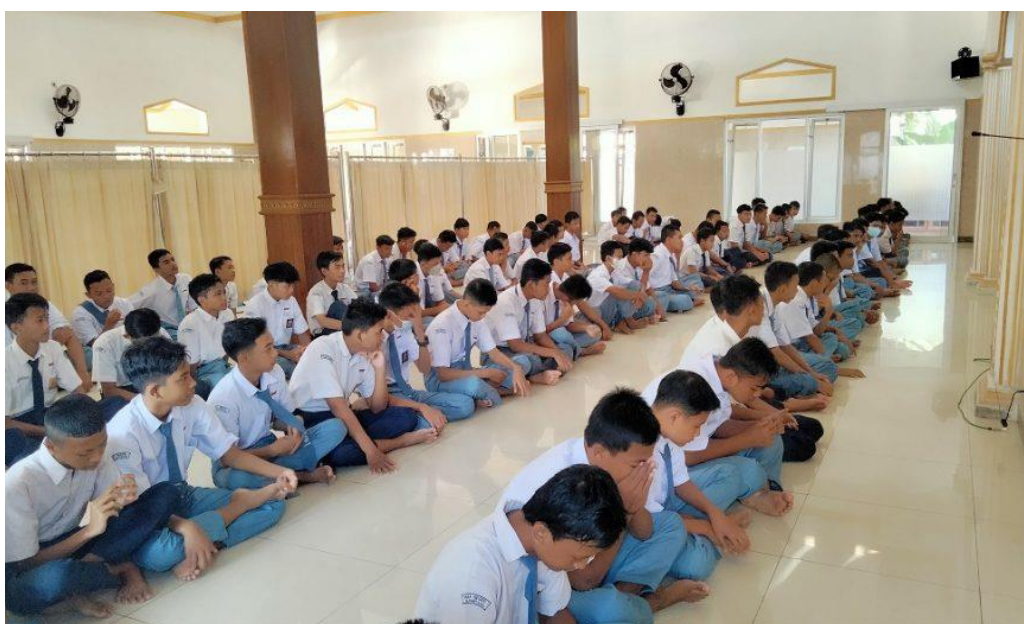
Gambar 2. Shalat Berjamaah

Adapun pengembangan kecerdasan spiritual siswa di SMAN 1 Adiluwih ialah membiasakan para siswa untuk berlaku hormat terhadap gurunya, senantiasa berdo'a bersama-sama, kemudian membiasakan untuk menghafal surat pendek, do'a, nasihat dan ajaran yang dijiwai oleh ajaran Islam, menghafal ayat-ayat al-Qur'an, belajar tajwid dan mengadakan sholat berjamaah. Kegiatan pembelajaran tersebut sesuai dengan tujuan dari lembaga SMAN 1 Adiluwih yaitu mencetak generasi yang paham Al-Qur'an dan mampu menerapkan dalam kehidupan sehari-hari, sehingga dapat menjadikan siswanya cerdas dan berakhlakul karimah. Salah satu kegiatan yang rutin dilakukan setiap hari yaitu shalat berjamaah, sebagaimana gambar berikut: